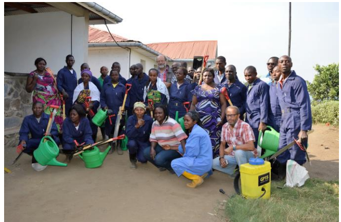
Stagiaires à la FEAGE